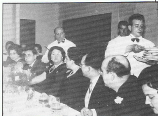
Primera "Cena de Señoras", celebrada en el Hotel Mediterráneo en 1963