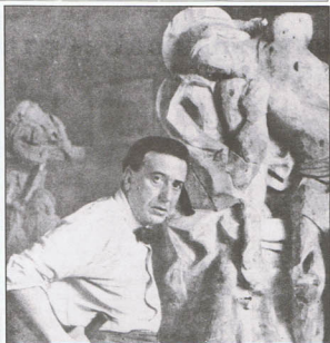
CAPUZ EN SU ESTUDIO

"En este momento hay que hablar precisamente del Descendimiento pues se trata de una obra de la que una parte importante de su interés y calidad reside ahí. Es una de las manifestaciones