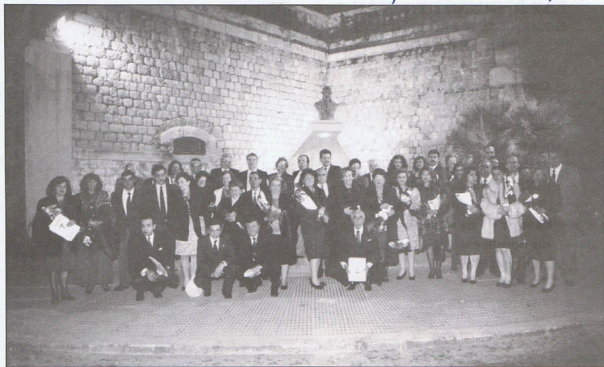
FOTO DE GRUPO DE ASISTENTES A LA VIGESIMO SEPTIMA "CENA DE SEÑORAS". EL MONUMENTO A CARLOS III FUE EL ESCENARIO DE LA FOTO DEL AÑO PASADO.