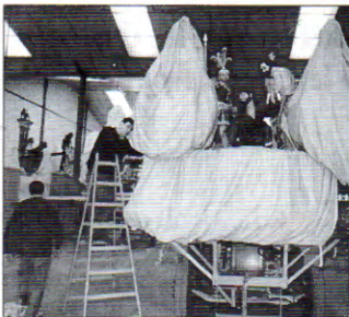
El nuevo grupo de "La Caída" llegó ayer de Málaga a los almohanes de la Cofradía Marraja.

Las nuevas figuras han sido talladas por el escultor gallego situado en Málaga Suso de Marcos y han costado una tre-