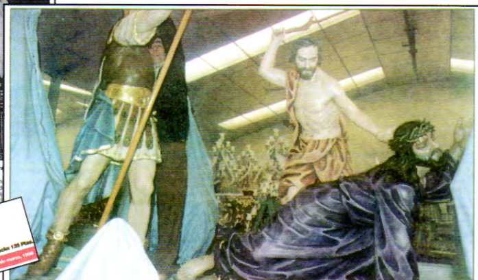
Tres nuevas figuras para "La Caída". El nuevo trono de "La Caída", de la agrupación marraja del Descendimiento, ya se encuentra en Cartagena después de que el escultor gallego Suso de Marcos tallase en madera las tres nuevas figuras. La novedad del trono está en que al Jesús y al sayón que le fustiga se les ha unido un soldado romano que vigila al primero. El trono, que ha costado tres millones y medio de pesetas, estará expuesto al público en la capilla de la Cofradía Marraja, junto a la iglesia de Santo Domingo, a partir del próximo día 15. CARLOS GALLEGU

Los marrajos intentan mejorar su patrimonio artístico con el nivel de las esculturas que los salidas.