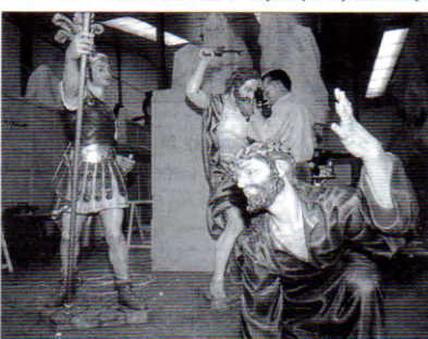
Las nuevas imágenes de La Primera Caída, ayer en el almacén de la Cofradía Marraja.

principales características del único grupo escultórico que se estrenará este año en la Semana Santa, es el que Cristo es custodiado por un sayón en presencia de un soldado, en la diferencia de las letras que ha logrado el autor con la madera de cedro de Chile.