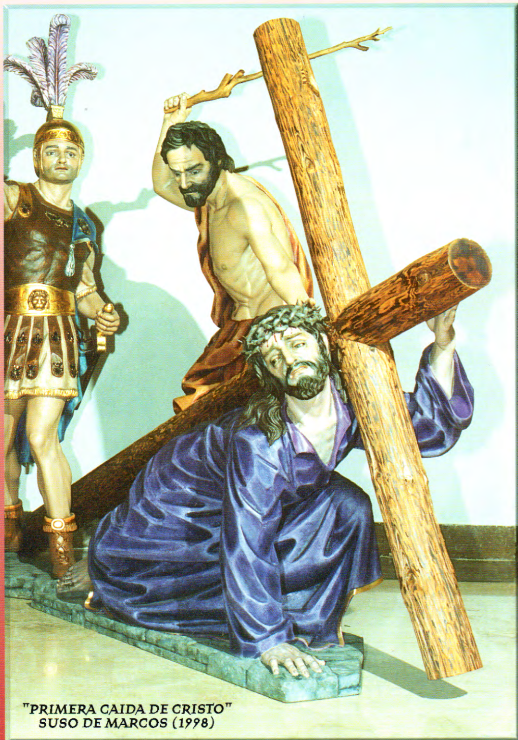
"PRIMERA CAIDA DE CRISTO" SUSO DE MARCOS (1998)