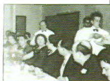
Primera "Cena de Señoras", celebrada en el Hotel Maderocero en 1963

"QUE SIGAMOS JUNTOS HASTA LAS BODAS DE ORO"