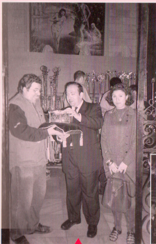
FUELLE FEMENINO, ENTRANDO EN SANTA MARÍA