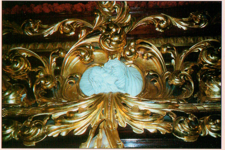
Detalle de la peana del Descendimiento.