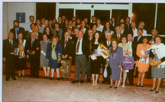
Foto de Grupo de la XXXVIII Cena de Señoras

La Madrina con las flores y la nota de sus palabras