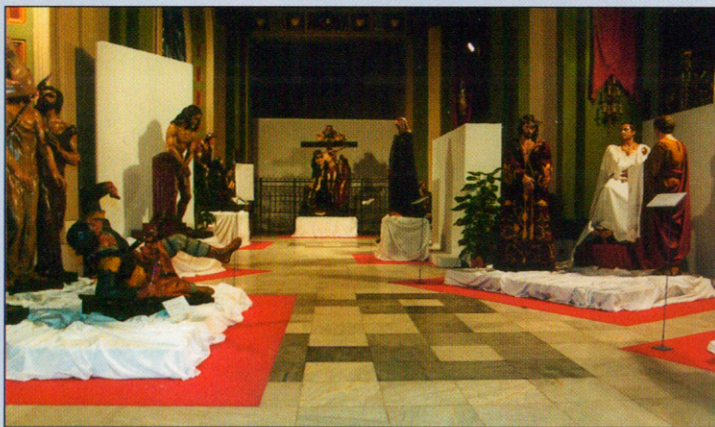
El Descendimiento al fondo de la nave izquierda de Santa María de Gracia, en la exposición celebrada hace unos meses. Exposición "La Pasión en Cartagena". Noviembre-Diciembre de 2.001