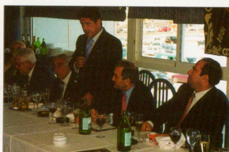
Federico Trillo-Figueroa Martínez-Conde pronuncia unas hondas reflexiones sobre el Descendimiento