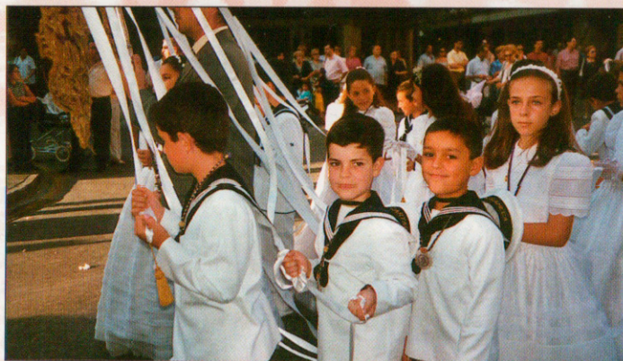
Hermanos del Descendimiento en la Procesión del día de Corpus Christi