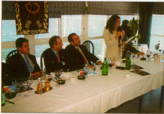
La Madrina de 2.001 dirigiéndose a la Agrupación, en la multitudinaria Comida del Tercio