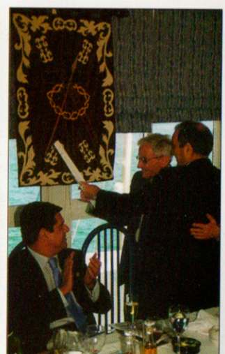
El capellán recibe del Hermano Mayor una patente de marrajo