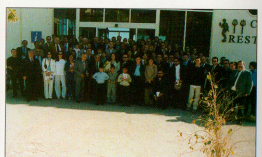
Foto de Grupo. Se da la curiosidad de que hubo dos fotos de grupo. La primera, en la que no estábamos todos y la segunda, que es la buena