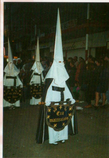
El fuelle del Paso de la Primera Caída, el principio de los penitentes del Descendimiento